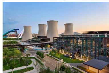
打卡新地標『首鋼園』

『駝鈴古道』：北京千年古道、百年老街，全長1500米的模式口大街東西橫貫，呈九曲龍形傳統風水格局。置身其中，是古韻與新生的奇妙碰撞。